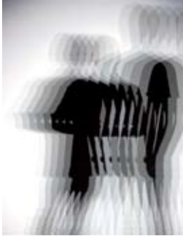
Olafur Eliasson Slow-motion shadow , 2009 HMI lamps, steel Dimensions variable