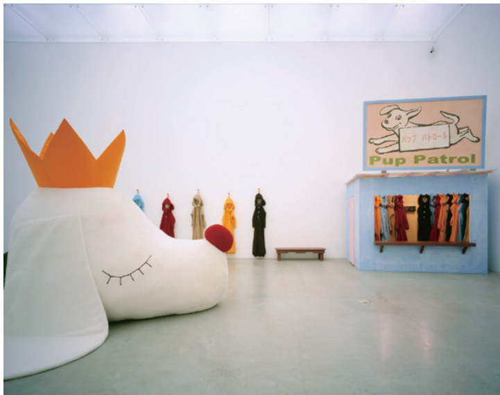
奈良美智《Dog-o-rama》2006 金沢21世紀美術館蔵 ©Yoshitomo Nara