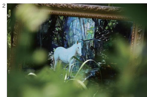
2 富安由真《The Pale Horse 蒼ざめた馬》2021 ©Yuma Tomiyasu 撮影：富安由真

※アーカイヴのため、後日、掲載誌（紙）、URL、番組収録のDVD、CDなどをお送りください。以上、ご理解・ご協力のほど、何とぞよろしくお願いいたします。