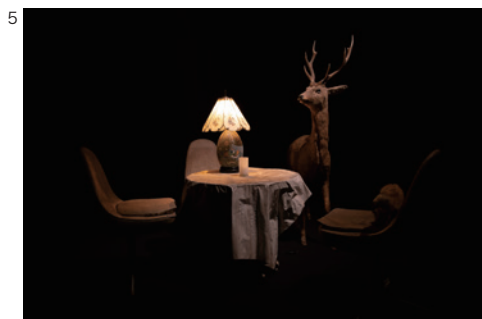
5 富安由真《漂泊する幻影》2021 KAAT 神奈川芸術劇場〈中スタジオ〉展示風景