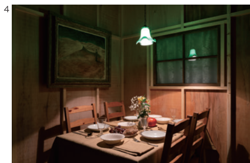
4 富安由真《Making All Things Equal》2019 アートフロントギャラリー展示風景 ©Yuma Tomiyasu 撮影：加藤健