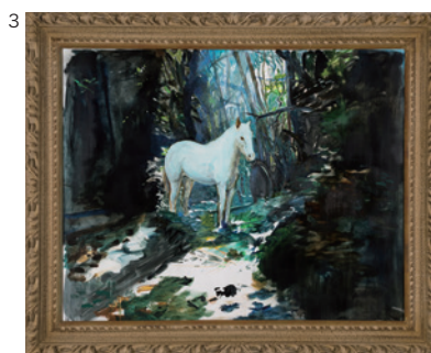
3 富安由真《The Pale Horse 蒼ざめた馬》2021 ©Yuma Tomiyasu 撮影：野口浩史 Courtesy of ART FRONT GALLERY