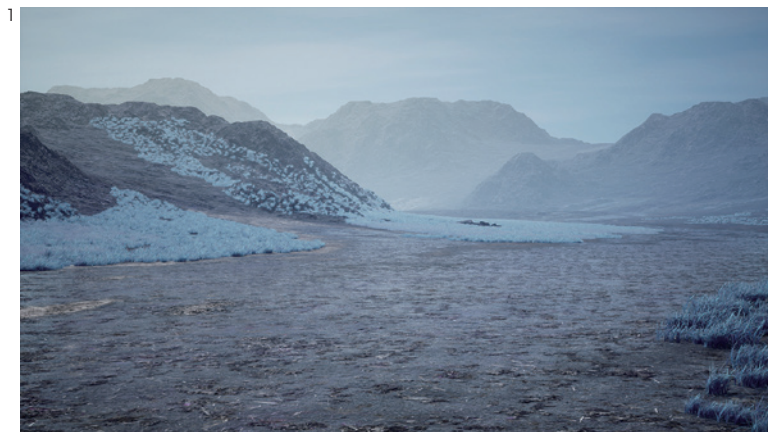
原田裕規《Waiting for》2021 © Yuki Harada

一見対照的な二作品ですが、いずれにも、膨大な情報と向き合い、それを身体化しようとする人間の姿が記録されています。こうした行為を、作家は「Waiting (待つこと／待ちながら)」という言葉で表現しています。かつてあった存在を見つめ、訪れるかもしれない何かを待つ。それは、出来事の前と後に挟まれた空白の時間に身を委ねる行為と言えます。本展は、人々が日々膨大な量の情報を手にすると同時に手放していく現代において、世界と向き合う一つの態度を示す機会となるはずで