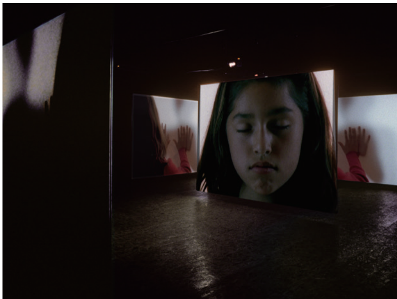
Doug Aitken, i am in you , 2000, Installation view: Galerie Hauser & Wirth & Presenhuber, Zürich, 2000, © Doug Aitken, Courtesy of the artist; 303 Gallery, New York; Galerie Eva Presenhuber, Zurich; Victoria Miro Gallery, London; and Regen Projects, Los Angeles