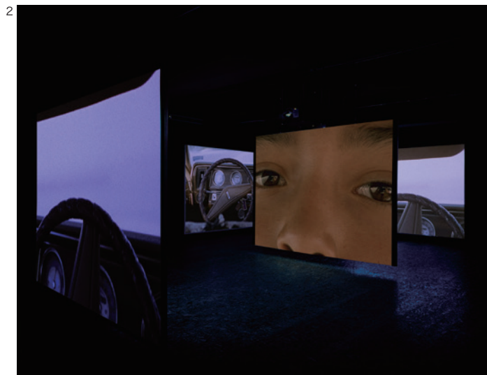
Doug Aitken, i am in you , 2000, Installation view: Galerie Hauser & Wirth & Presenthuber, Zürich, 2000, © Doug Aitken, Courtesy of the artist; 303 Gallery, New York; Galerie Eva Presenthuber, Zurich; Victoria Miro Gallery, London; and Regen Projects, Los Angeles

ダグ・エイケンによる映像インスタレーションのダイナミズムを金沢21世紀美術館の大空間で体感していただける貴重な機会となるでしょう。