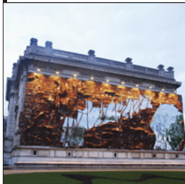
Ei Anatsui《Broken Bridge》2012 ※参考図版(この作品は出品されません)