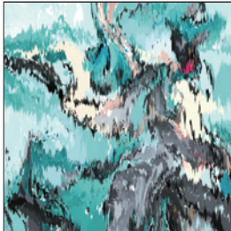
BCL + Semitransparent Design 《Ghost in the Cell》2015 © Crypton Future Media, INC.