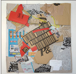
「あつめてキリバリ! だんだんコラージュ」より