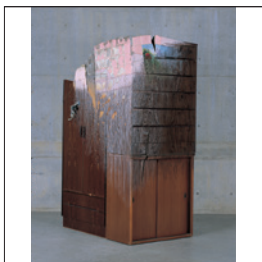
青野文昭《なのおす・代用・合体・連置 「震災後直理町荒浜で取捨した部屋 —壁面の復元」》2013

日時=2015年11月20日(金)13:30～14:00(受付13:00より) 場所=金沢21世紀美術館デザインギャラリー 内容(予定)=展覧会概要説明、アーティスト紹介、質疑応答 ※詳細は別途お知らせいたします。