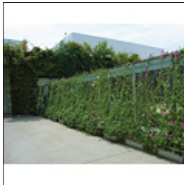
「サンセット～サンライズ・アーク」 光庭プロジェクト 展示風景