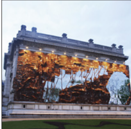
El Anatsui《Broken Bridge》2012 ※参考図版(この作品は出品されません)