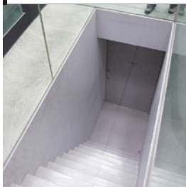
まるびいの不思議「行けない階段」